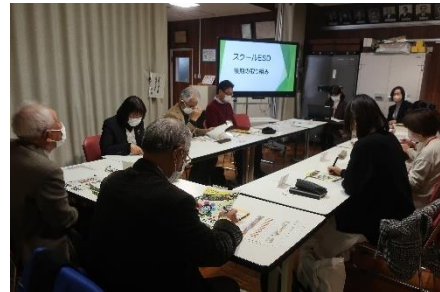
学校運営協議会での熟議

保護者や地域の皆様には、本校教育の推進にご理解とご支援をいただき誠にありがとうございました。来年も皆様の声を受け止め、学校運営を進めていきます。今後ともどうぞよろしくお願いいたします。