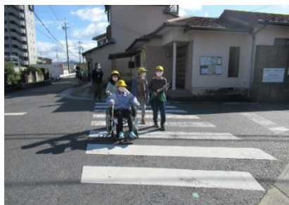
4年「みんなにやさしいまち」

※学校運営協議会は、老上学区のまちづくり協議会やPTAの代表など8名の方と教員4名（管理職や教務）で構成されていて、学校運営に対して目標やビジョンを共有しながらその改善に取り組む組織です。