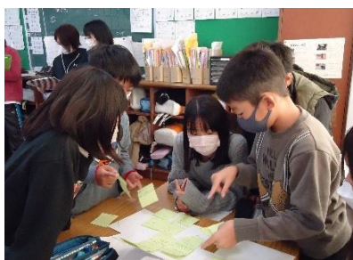
5年「地域の川を守ろう」